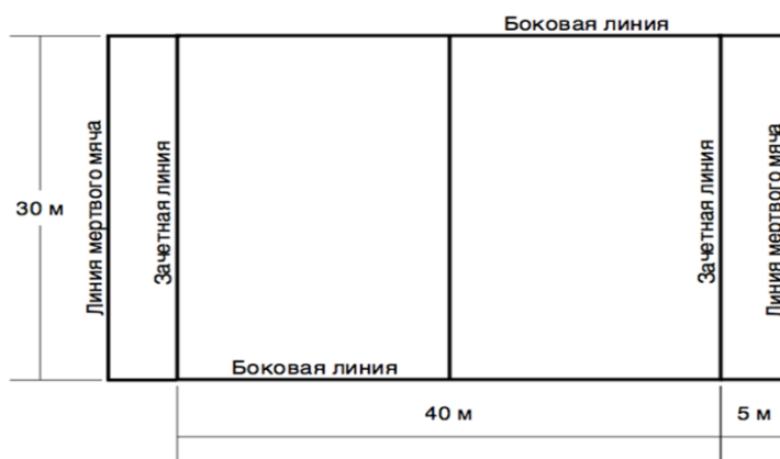
Рисунок 1 - Разметка площадки для игры тэг – регби

Линия зачетного поля - линия, за которую нужно приземлить мяч или забежать с мячом (если это предусмотрено правилами)